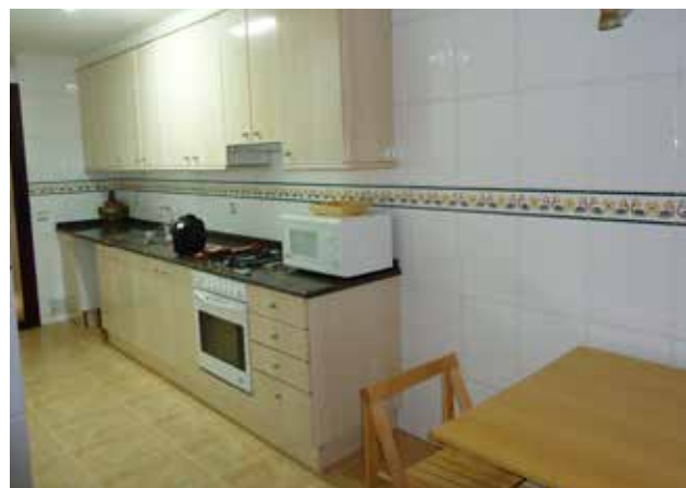
Cocina - comedor totalmente equipada.