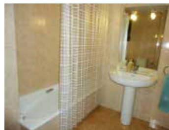
2º Baño completo