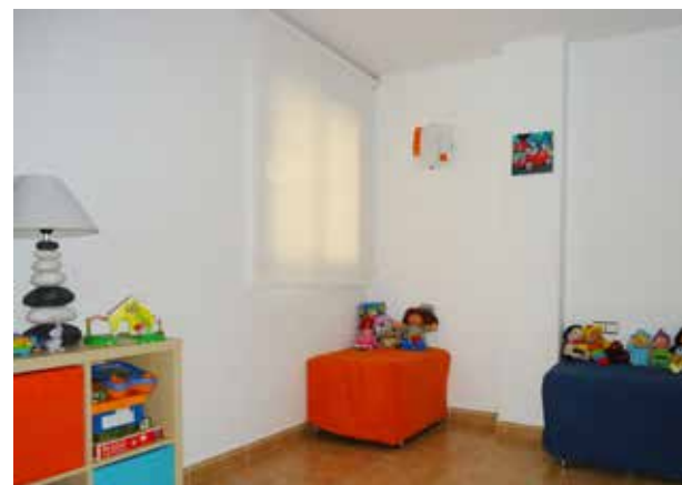
Habitación infantil con dos camas y juegos