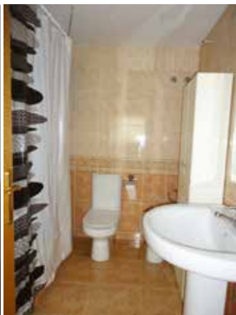
Habitación Suite equipada con baño completo y cama de matrimonio